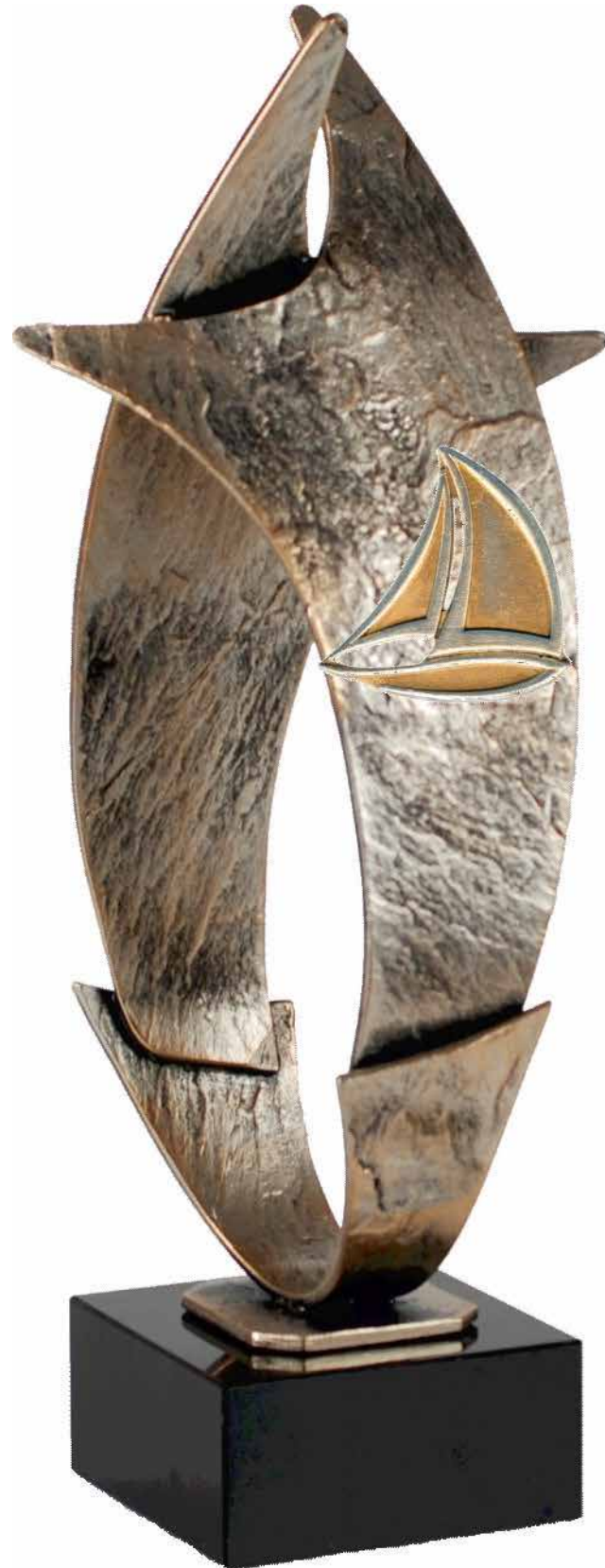
The Exclusive Shielmartin Diamond Trophy